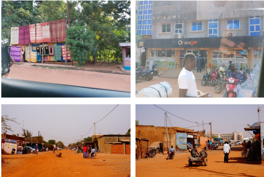
图 博博迪乌拉索市风光

布基纳法索全国人口约 1903 万（2016 年），人口密度每平方公里约 70 人，平均寿命约 53.7 岁。布基纳法索人口分布很不均衡，大部分人口集中在瓦加杜古、博博迪乌拉索等主要城市，特别是瓦加杜古地区人口密度最大，约占布基纳法索总人口的 13%。西南部和中南部的卡斯卡德大区、西南大区和中南大区人口密度最低。华人多集中于首都瓦加杜古地区。