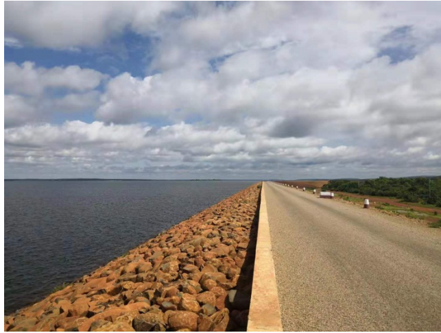
图 布基纳法索公路

陆路交通以汽车为主，布基纳法索新城街道情况较好，老城区情况较差。租车通常是看搭乘的交通工具以及路面状况开价，花费一般都在一公里 7 CFA ~20 CFA 之间，很少会超出这价格。城市内交通主要靠摩托车、出租车、私家车等交通工具，公共交通线路十分有限，远远无法满足日常出行。