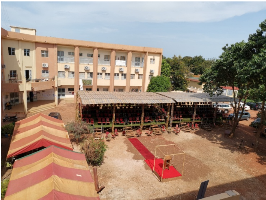
图 孔子学院所在校区

【医疗】布基纳法索医院的医疗设施多集中于首都瓦加杜古等大 城市，农村地区医疗条件简陋。正规医院配备 X 光机、CT 机等大型 进口医疗设备，核心医务人员多为赴美国、法国等西方国家留学人员 学成回国，技术水平相对较高。布基纳法索实行医药分开，患者凭处 方在药店自行买药，多数药均为法国进口。医药费用较高，但与国内 看病费用相当。博博迪乌拉索市中心有正规医院 1 所，一般疾病诊治， 化验均没有问题。