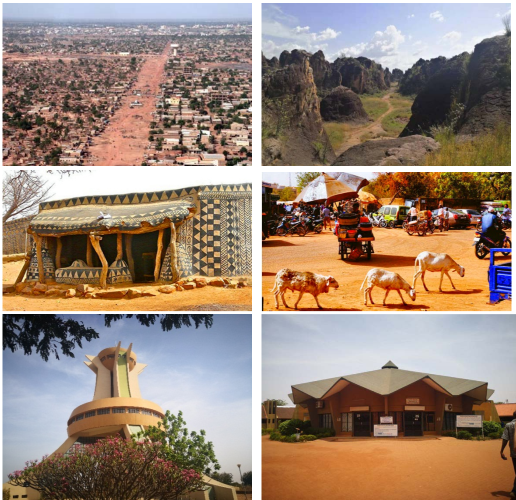
图布基纳法索风光