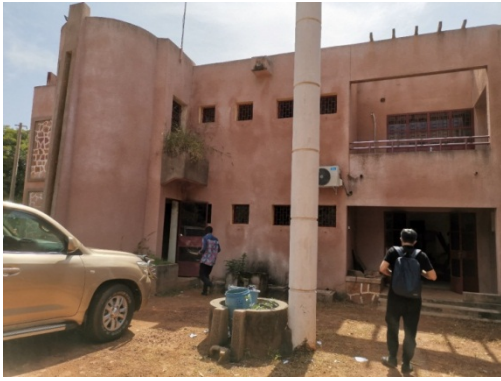
图博博迪乌拉索工业大学行政楼