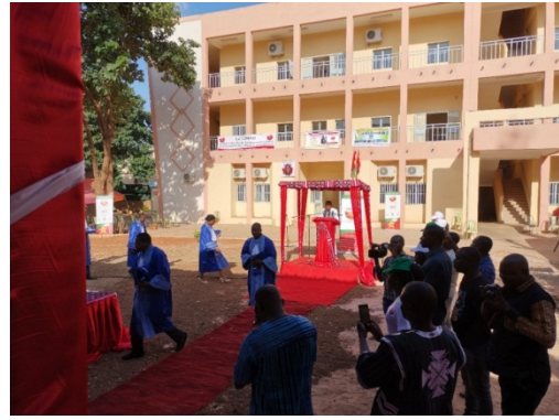
图孔子学院教学楼揭幕式